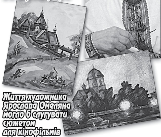
Життя художника Ярослава Омеляна могло б слугувати сюжетом для кінофільмів