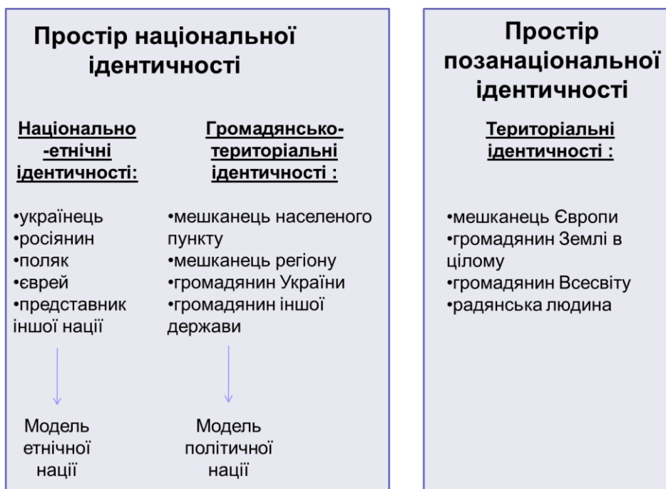
Рис. 2. Концептуальна схема ідентитетів як параметрів виділення кластерів

Набір ідентитетів, пов'язаних з національною ідентичністю, та їхнє розташування у концептуальний ряд ми пропонуємо пов'язувати з пошуком траєкторії можливої соціальної ідентичності держави – «етнічної» (модель етнічної нації) чи «громадянської» (модель політичної нації). Це дозволить віднайти спільні «ідентифікаційні траєкторії», що можуть лягти в основу державотворчої політики. У виділенні індикаторів ідентифікаційних практик не слід забувати й про інтенсифікацією «глобалізаційно-локалізаційних» процесів, відповідно, індикатори досліджуваних ідентитетів розведені в два простори: простір національної ідентичності та простір позанаціональної ідентичності (див. рис. 2).