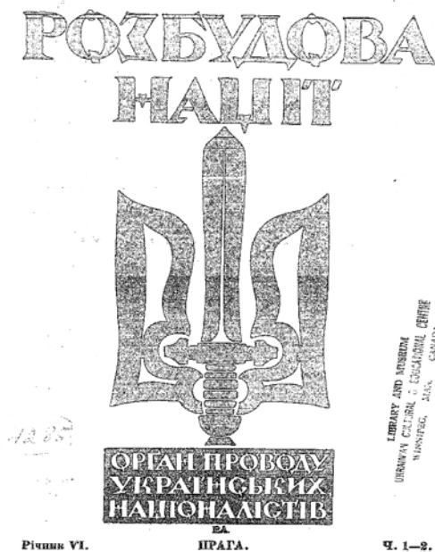
Зображення 4. Відзнака ОУН