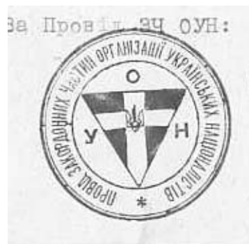
Зображення 2. Печатка станиці ОУН