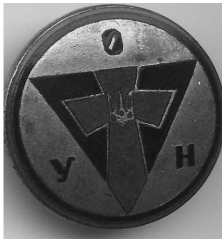
Зображення 6. Відзнака ОУН(б).

Документи публікуються за сучасними правилами археографії при збереженні їх лексичних і орфографічних особливостей. Розшифровані скорочення у тексті, ініціали, пропущені букви, слова позначені квадратними дужками. Матеріали, що публікуються, мають важливе наукове значення і є цінним історичним джерелом, що дозволяє доповнити та уточнити окремі події і факти з діяльності ЗЧ ОУН.