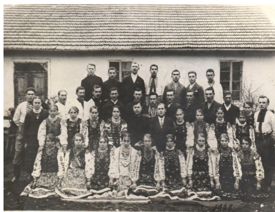
Хор с. Мужилівчч (1928)