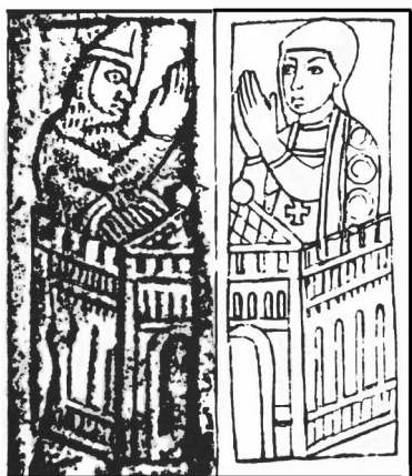
Рис. 4. Кістяна пластина – оклад ікони XI-XII ст. з розкопок Я. Пастернака у Пліснеську 1940 р. Реконструкція М. Левицького.

На підставі отриманих результатів Я. Пастернак розкриває соціальну топографію княжої столиці. Дослідник вважав, що розвиток планової структури Галича відбувався за моделлю, яку прослідкував М. Каргер для середньовічного Києва. Першим осередком міста був заселений у IX-X ст. Золотий Тік – невелике городище, перетворене пізніше у княжий двір з церквою св. Спаса. Південніше знаходилося передгороддя (до знівельованого валу в ур. Качків). Ярослав Осмомисл розширив місто далі на південь, спорудивши потрійну лінію оборони та спорудив Успенський собор і низку білокам'яних храмів в околицях міста 21 .