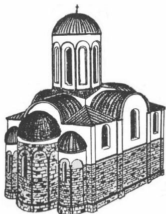
Рис. 3. Церква Св. Пантелеймона в околицях княжого Галича (поч. XIII ст.). Реконструкція Й. Пеленського.

У 1911-1912 рр. Й. Пеленський здійснив археологічні розкопки з метою пошуку фундаментів Успенського собору, які, на думку дослідника, мали знаходитися на місці парохіяльної церкви Успіння Пресвятої Богородиці у Крилосі. Викопавши навколо церкви кілька шурфів глибиною до 3 м, Й. Пеленський встановив, що храм побудований на місці руїн ранішої