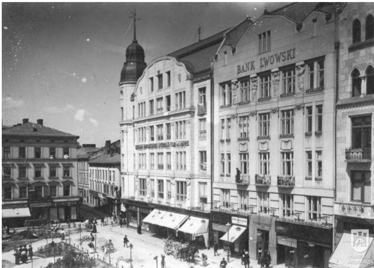
Колишній банк Львівський на вулиці Валовій 9.

своєрідної банківської архітектури можна назвати: будівлю Австро-Угорського банку (вул. Листопадового чину, 8) зведену в 1912-1913 рр., будівлю Празького банку (вул. Гнатюка, 2) побудовану в 1912 році, споруду Колишнього Земського Кредитного Товариства, а тепер будівлю Нацбанку України (вул. Коперника, 4), зведену протягом 1912-1913 рр., Прибутковий будинок Т.Балабана (Валова, 7) – 1909-1911 рр.