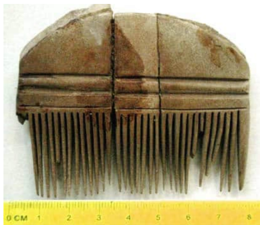
Рис. 2. Одношаровий гребінь з поселення вельбарської культури Дудин II (фонди Бродівського краєзнавчого музею).

До другого типу першої групи знахідок належать одношарові гребені, що склалися з трьох частин, скріплених за допомогою повздовжнього залізного штифта. Вони є характерними для пам'яток вельбарської та черняхівської культур, проте трапляються нечасто. Зокрема, один із таких екземплярів виявлений на вельбарському поселенні Дудин II [Онищук, 2000, с. 13–31]. Він складений з трьох частин, скріплених по довжині залізним стержнем. Спинка дугоподібною форми і закінчується конічним пружкоподібним виступом. Виріб орнаментований двома прямими горизонтальними лініями (рис. 2). Довжина гребеня становить 8 см, висота – 6,5 см. На вельбарському могильнику Брест-Трішин відомі три такі гребені [Кухаренко, 1980, с. 54]. Один із них орнаментований концентричними кружечками і горизонтальними