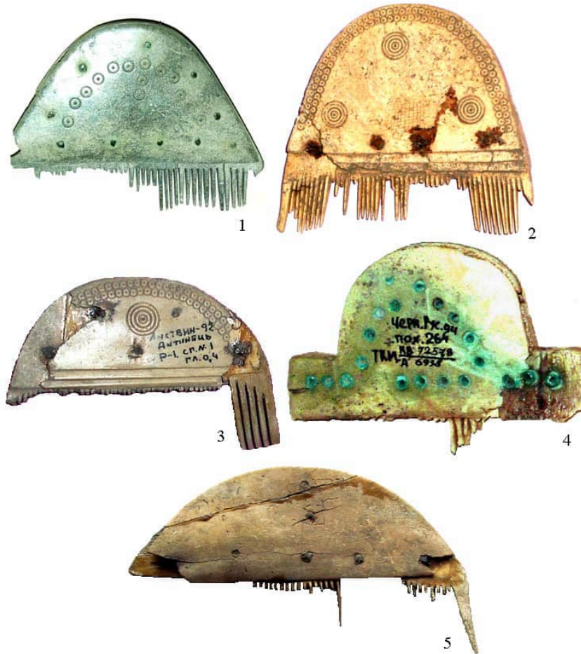
Рис. 4. Тришарові гребені: 1 – Бовшів II (поселення черняхівської культури) (фонди Археологічного музею ЛНУ імені І. Франка); 2 – Чернелів-Руський (могильник черняхівської культури) (фонди Тернопільського краєзнавчого музею); 3 – Листвин (фонди Археологічного музею ЛНУ імені І. Франка); 4 – Чернелів-Руський (могильник черняхівської культури) (фонди Тернопільського краєзнавчого музею); 5 – Сокільники I (фонди Історико-краєзнавчого музею м. Винники).

Fig. 4. Combs with three layers: 1 – Bovshiv II (Cherniakhiv culture settlement) (funds of Archaeological Museum of Lviv University); 2 – Cherneliv-Rus'ky (Cherniakhiv culture necropolis) (funds of Ternopil Museum of local history); 3 – Lystvyn (funds of Archaeological Museum of Lviv University); 4 – Cherneliv-Rus'ky (Cherniakhiv culture necropolis) (funds of Ternopil Museum of local history); 5 – Sokilnyky I (funds of Vynnyky Museum of local history).