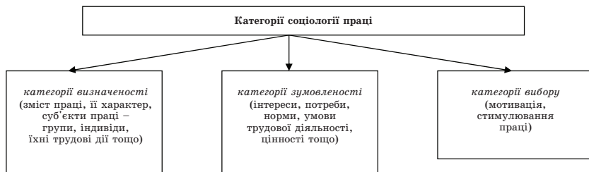
Рис. 1. Основні групи категорій соціології праці

ним: вступають у безпосередні чи опосередковані стосунки, зв'язки, які реалізуються як на суспільному, так і на міжособистісному рівнях. Під соціальними взаємодіями у сфері праці розуміють форми зв'язків, які реалізуються в обміні умінням, досвідом, навичками, знаннями, вербальними чи конкретними діями. Об'єктивну основу соціальних взаємодій формує спільність чи розбіжність інтересів, цілей, поглядів. За певних соціальних умов постійні взаємодії породжують соціальні відносини – відносини між окремими людьми, соціальними групами, що беруть неоднакову участь в економічному, політичному і духовному житті; мають різні і соціальний статус, і спосіб життя, і джерела й рівні доходів особистого споживання тощо. Ці відносини складаються через суспільне становище суб'єктів, їхній устрій життя, умови існування і є одним зі способів вияву соціальності у суспільстві, в т. ч. й у трудовій сфері.