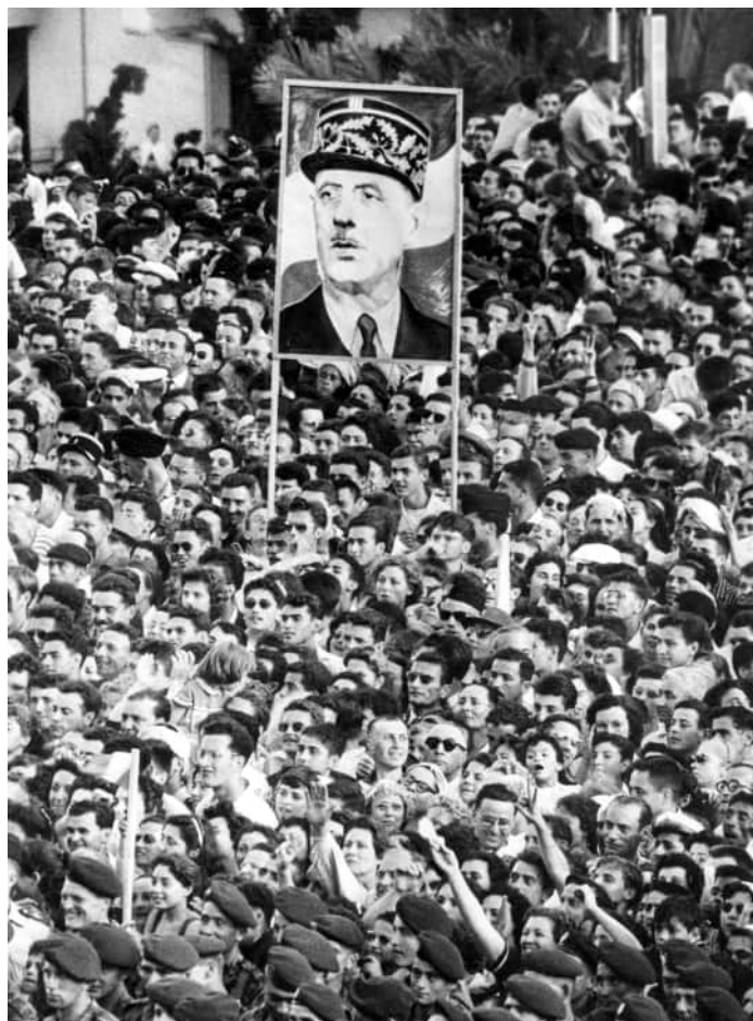
Натовп вітає нового главу уряду, Алжир, 4 червня 1958 р.