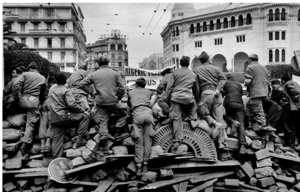
Тиждень барикад, Алжир, січень 1960 р.