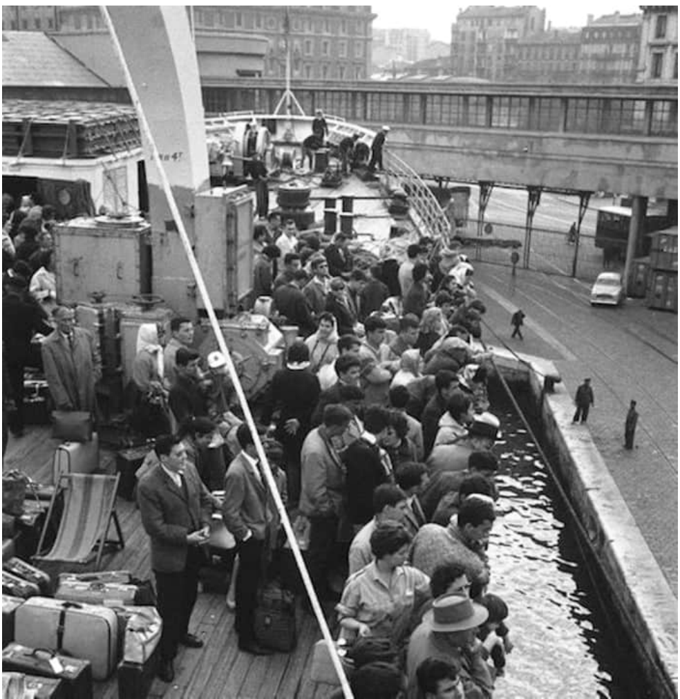
Чорноногі тікають до Франції