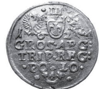
Фото 5. Тригрошовик Сігізмунда III з 1624 року, вагою 1,84 г.