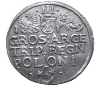
Фото 4. Тригрошовик Сігізмунда III з 1619 року, вагою 1,66 г.