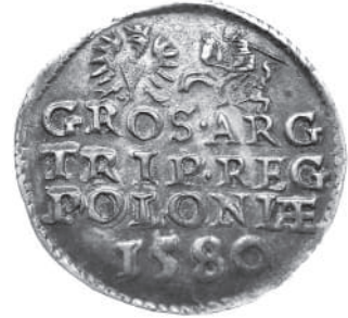
Фото 2. Тригрошовик Стефана Баторія з 1580 року, вагою 2,34 г.