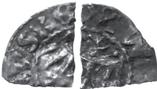
Рис. 11. Два фрагменти розламаного грошика Владислава Ягайла з приватної колекції.

На цікаві роздуми щодо важливості обігу на галицьких ринках мідної місцевої монети наштовхує скарб, знайдений у м. Белзі – колишній столиці одного з удільних волинських князівств. Знахідка складалася всього з двох невеликих частинок розламаного галицько-руського грошика Владислава Ягайла (Рис. 11). Тип грошика 7 “в”, карбований приблизно у 1394–1398 рр. 12