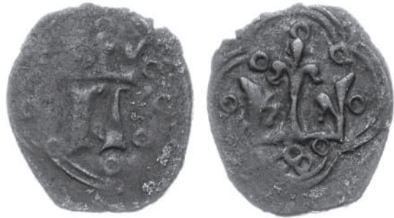
Рис. 9. Денарій Владислава Опольського з приватної колекції із зображенням прямокутної корони.

Карбування денаріїв з прямокутними коронами (Рис. 8) у 1371–1372 рр. підтверджується наявністю перших типів денаріїв Владислава Опольського, де поєднується ініціал князя на аверсі та прямокутна корона на реверсі (Рис. 9). Зафіксовано таку ж прямокутну корону на декількох стандартних денаріях Людовика Угорського (вони виставлялися на аукціоні WCN у 2016–2018 рр. і їхня вага складала всього 0,87 г, 0,89 г, 0,75 г, що вказує на їх випуск у перші роки правління Людовика – орієнтовно 1379–1380 рр. – Рис. 10). Важчих денаріїв Людовика з прямокутною короною не зафіксовано.