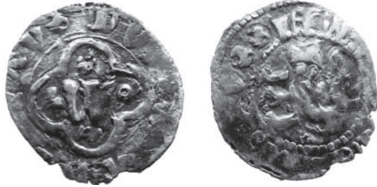
Рис 1. Грошик Владислава Опольського з приватної колекції з легендою реверсу “MONETARUSSIEW”.

дивною легендою до Л. М. Д. (якби всі три монети мали б ознаки однієї руки, то могло б здатися, що їх підробляли підпільно, а не виготовляли на Л. М. Д.).