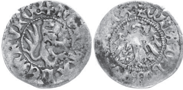
Рис 3. Півгріш Владислава Опольського з приватної колекції з левом направо.

Саме при вивченні цієї монети польському досліднику Вітольду Боровському вдалося встановити, що штемпель її реверсу виготовив майстер, який до 1407 р. виготовляв коронні півгроші у Кракові. Його монети мали свої характерні риси не притаманні іншим краківським майстрам. Ці ж аналогічні риси В. Боровському вдалося знайти на трьох львівських півгрошах. Всього три монети і всі гібриди – дві у поєднанні з штемпелями майстра VI і одна у поєднанні з штемпелем майстра VII. Жодної монети, де штемпелі обох сторін виготовив би новий майстер, названий нами майстром VIII, поки що не виявлено, що може вказувати на короткочасність його перебування у Львові.