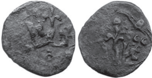
Рис 6. Денарій з колекції О. Базара із зображенням корони на обох сторонах монети, одна з яких має вивернуті краї.

Появилася й інша група мідних монет, яка вимагає детального вивчення. Це денарії, на обох сторонах яких зображено корону, але одна з цих корон має бокові краї, вивернуті назовні (Рис 6). Середня вага 4 шт. таких денаріїв із колекції О. Базара складає 1,14 г.