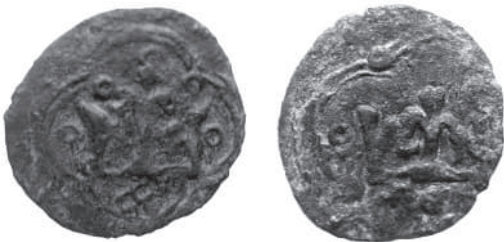
Рис. 8. Денарій з колекції Ю. Котика із зображенням корони на обох сторонах монети, одна з яких є прямокутною.

Крім того, на денаріях з 1371–1372 рр. зустрічаються прямокутні корони., але не відомо жодного варіанту денаріїв з коронами на обидвох сторонах, де поєднувалися б прямокутна корона і корона з вивернутими краями. Очевидно ці два варіанти двокоронових денаріїв випускали у різні роки.