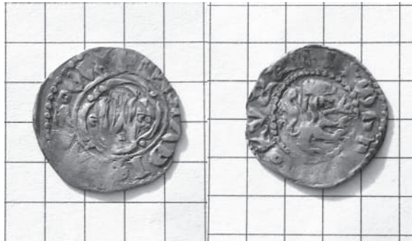
Рис 2. Грошик Владислава Опольського з приватної колекції з левом направо.

За останні роки знайдено теж рідкісні монети з реверсом, на якому лев повернутий направо. Одна із них – це Грошик Владислава Опольського, про який вперше згадав колекціонер К. Стецький ( Wiadomości Numizmatyczne , W–wa. 1996 r., Nr 4, str. 237). При складанні першої версії каталогу автор у жодній з вивчених музейних і приватних колекцій такого різновиду грошика не виявив ( Рис. 2 ).