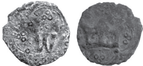
Рис. 10. Денарій Людовика Угорського з приватної колекції із зображенням прямокутної корони.

Тобто, у період першого “безкоролів’я” в 1371–1372 рр. випускали монети з коронами на обох боках, деякі з них мали на реверсі прямокутну корону. На те, що штемпель з прямокутною короною не виготовляли за життя Казимира III, а тільки після його смерті, вказує відсутність денаріїв з ініціалом “К” і подібною короною. Виглядає, що їх спеціально виготовили для випуску “безіменних” монет. Після приїзду Владислава Опольського до Львова збережені штемпелі реверсу з прямокутною короною використали для карбування його стандартних денаріїв, а також перших типів монет Людовика Угорського.