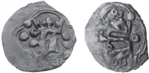
Рис. 7. Денарій Людовика Угорського з колекції І. Федая із зображенням корони з вивернутими краями.

Ці монети не можна віднести до згаданих раніше двокоронових денаріїв, карбованих у Львові в 1371–1372 рр., адже на денаріях з ініціалом Казимира III не зафіксовано жодного випадку застосування корон із вивернутими краями. Натомість, такі корони бачимо і на деяких денаріях з ініціалом Людовика (Рис. 7).