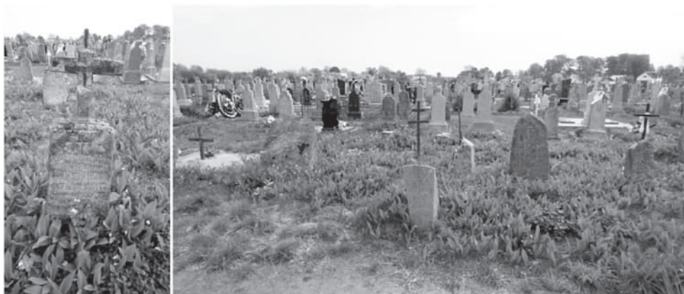
Рис. 7. Могильные памятники с размещением легенды на тыльной стороне в старой части кладбища, вид с запада (на переднем плане)

Ныне действующие “Правила” 2016 г. допускают обустройство семейных (родовых) захоронений, в порядке, установленном частью седьмой статьи 35 Закона Республики Беларусь “О погребении и похоронном деле”, на которых разрешается резервирование участка для захоронения сверх участка для захоронения, предоставляемого на безвозмездной основе 31 . Другими словами, сложившаяся практика обустройство семейных (родовых) захоронений была узаконена.