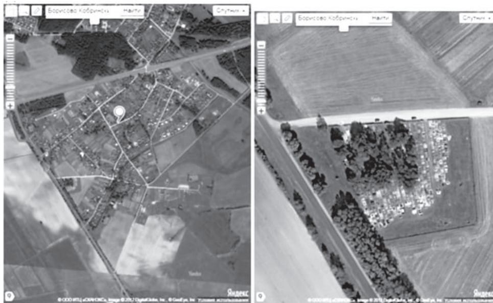
Рис. 1. Деревня Борисово Кобринского района (к югу от магистрали М-1/Е 30); кладбище д. Борисово. Кроны лиственных деревьев маркируют старую часть кладбища, трава – недавно прирезанную территорию. Google Globe 2012.

Кладбище д. Борисово ныне имеет вид неправильного четырехугольника с длиной северной линии ограждения (вдоль полевой дороги деревни к трассе М-10 вдоль кладбища) 130 м, западной (параллельно трассе М-10) – 105 м, восточной (сторона к деревне) и южной (параллельно полевой дороге) около 90 м. Общая площадь составляет 1,2 га.