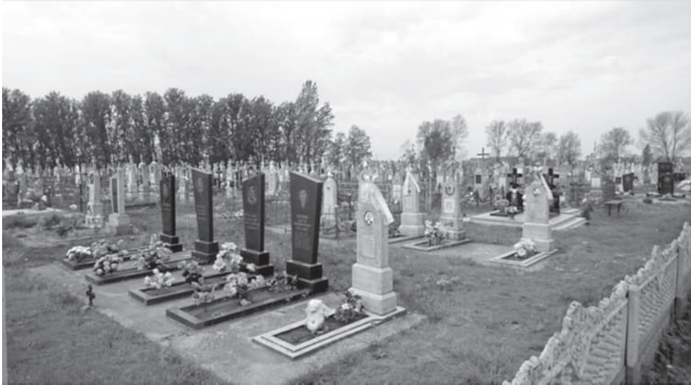
Рис. 2. Современный вид кладбища д. Борисово без деревьев на территории некрополя. Вид с северо-запада, состояние на 1.05.2018 г.

ния. По мнению работников сельсовета столь значительное увеличение захоронений – на \frac{2}{5} – менее чем за четверть века вызвано захоронениями живших в г. Кобрине уроженцев д. Борисово и д. Магдалин, а также их родственников.