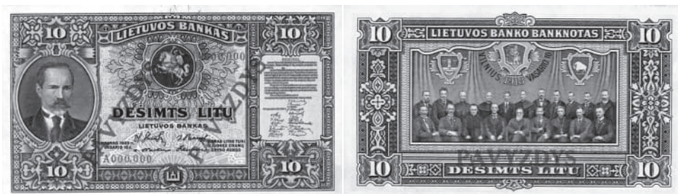
Рис. 1. Литва. 100 литів. 1938 р. Ювілейна банкнота на відзнаку 20-річчя незалежності Литви

У 1938 р. з нагоди 20-річчя незалежності Литви було запропоновано Банку Литви видрукувати ювілейну банкноту номіналом в 10 літ із зображенням на аверсі герба Литви, Акта Незалежності та портрету голови Ради Литви і першого президента Литовської Республіки Антанаса Сметони. За проектом на реверсі передбачалось зобразити Раду Литви, яка прийняла Акт Незалежності. Автор проекту – Аадомас Гальдікас, типографія Bradbury, Wilkinson & Co Ltd (Англія). Задум ювілейної банкноти не був до кінця реалізований, однак, відомо, що після окупації Литви Радянським Союзом у 1941 р. у Каунаський державний музей культури (тепер - Національний музей мистецтва ім. М. К. Чюрльоніса) було передано 54 екз. зразків банкноти ( Рис. 1 ).