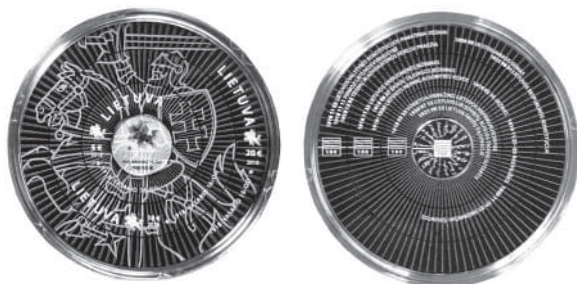
Рис. 4. Золота монета Литовської Республіки, 50 €. 2018 р.

нат – у квадраті напис на литовській мові “Відновлення держави 100”.