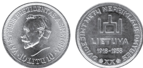
Рис. 3. Монета-сувенір. 1938 р.

Знаменно, що колекційні монети (5, 10, 20 и 50 €) мають кільцеподібний (50 € – дисковий) вигляд різного діаметру, і так, щоб монета меншого діаметру суміщалась б із монетою більшого діаметру, а всі разом склали б повний срібно-золотий диск (Рис. 4).