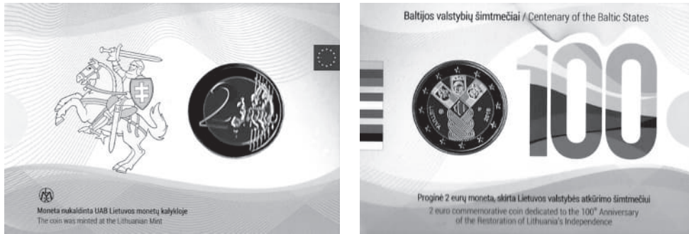
Рис. 6. Литовська монета 2 €, випущена до 100-річчя незалежності Литви в колекційній упаковці.