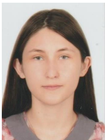
Король Марія Василівна