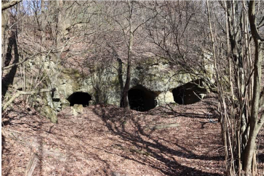
Артилерійські потерни під Лисою горою (сучасний стан)