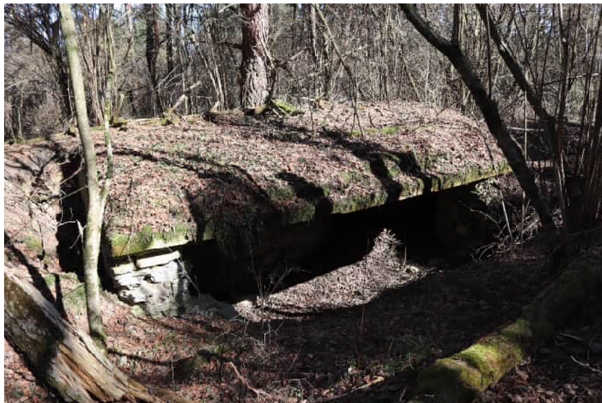
Залишки оборонних укріплень фортеці Миколаїв (сучасний стан)