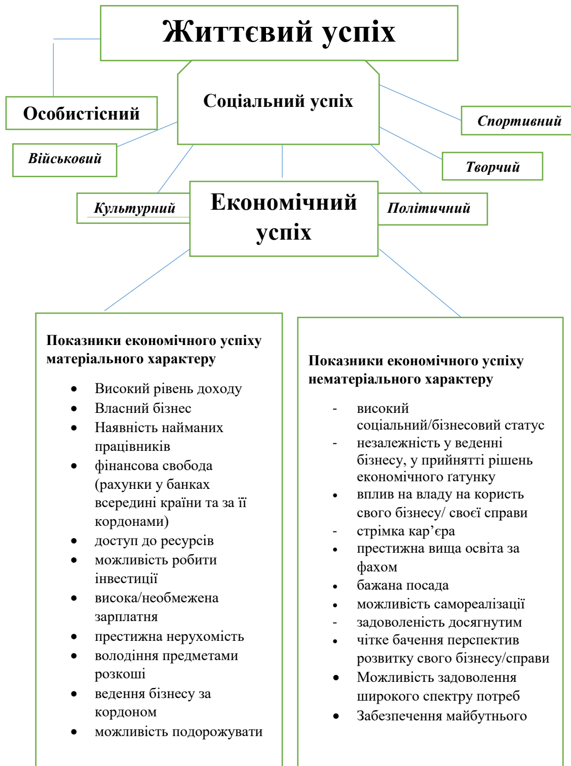
Таблиця 1.2.1. Економічний успіх та його показники.

економічного успіху внаслідок проведення авторського емпіричного дослідження (див. Табл. 1.2.1).